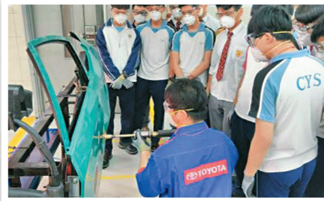
▲ 同學們進行汽車維修實習。