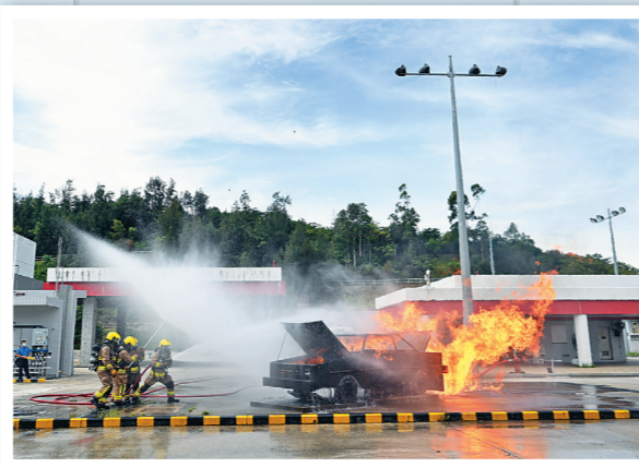
▲消防學員進行模擬救火訓練。

步 進位於將軍澳百勝角、佔地逾 16 萬平方米的消防及救護學院，猶如置身大學校園。這所現代化的院校於 2016 年正式啟用，由昔日三所訓練學校合併而成。消防及救護學院院長吳贊良表示：「作為部門的訓練搖籃，學院擔當薪火相傳的責任，為處方培訓人才，讓不同職系的人員有更多機會一同受訓，有助提升他們處理緊急事故的應變和協調能力。」