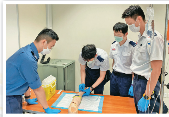
▲救護員進行模擬救護傷者訓練。